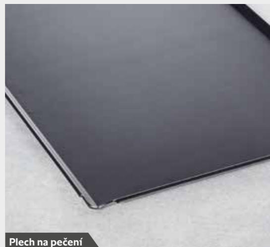
Plech na pečení