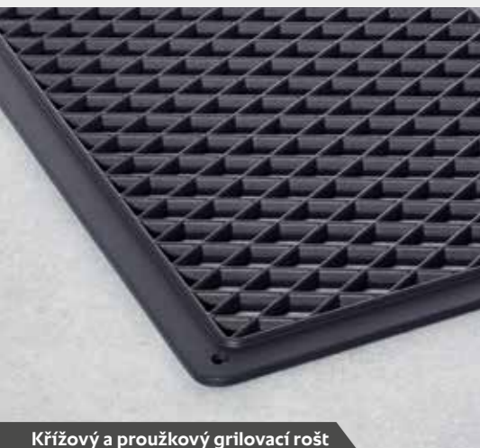
Křížový a proužkový grilovací rošt

V případě zájmu o další informace si vyžádejte náš prospekt Příslušenství nebo navštivte naše webové stránky www.rational-online.com .