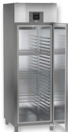
GGPv 6540 ProfiLine