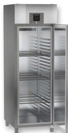
GKPv 6540 ProfiLine

Ledničky a mrazničky Liebherr pro profesionální použití nabízí perfektní chlazení i při vysokých okolních podmínkách teploty do + 40 °C (klimatická třída 5). Vysoce moderní komponenty, výkonná a ekologická chladiva a přesné řídicí systémy jsou optimálně koordinovány, aby odolaly náročným praktickým požadavkům s mnoha cykly otvírání dveří. V důsledku je kvalita výrobků a čerstvost spolehlivě udržována – a spotřebiče jsou vždy úsporné.