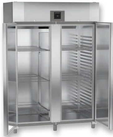
GGPv 1440 ProfiLine